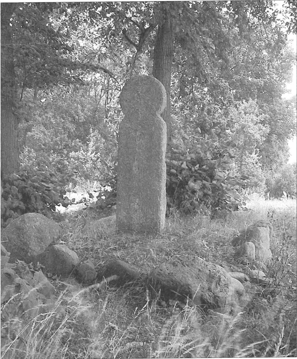
Ilustr. 5. Kamień dziękczynny w Krępcowie, pow. stargardzki. Strona frontowa. Stan obecny.