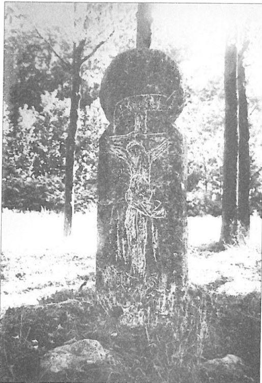
Ilustr. 4. Kamień dzięczyny w Krępcowie, pow. stargardzki. Strona frontowa. Stan z początku XX w.