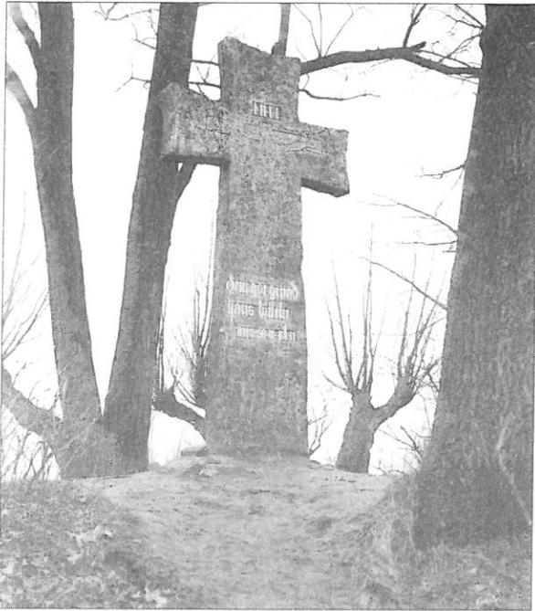
Ilustr. 1. Krzyż pokutny w Stargardzie. Strona frontowa. Stan z przełomu XIX i XX w.