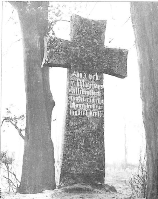
Ilustr. 2. Krzyż pokutny w Stargardzie. Odwrocie. Stan z przełomu XIX i XX wieku.